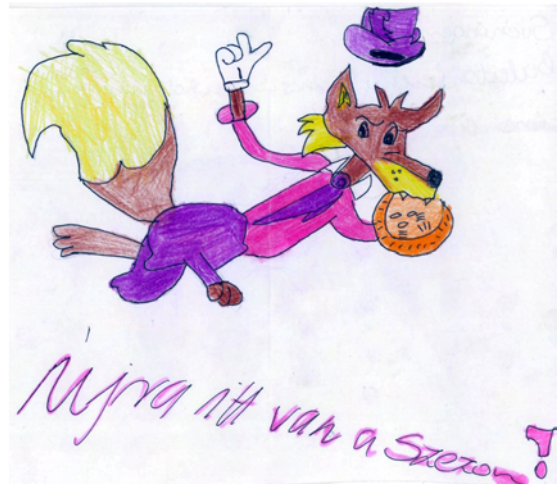
Svéninger Dóra: Újra itt van a szezon