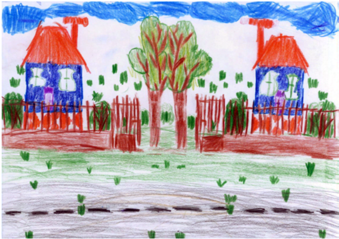
Viola Márk: Tükörkép 2.